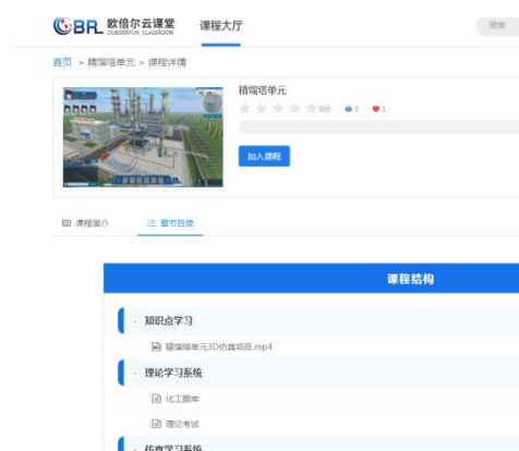
图 3 虚拟仿真实验平台