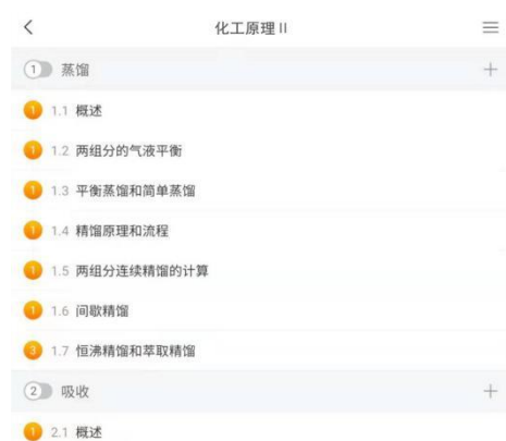
图 2 超星学习通 APP

课程将信息技术与传统课堂进行了一定的融合。课程采用线上+线下混合式教学，通过超星学习通发布线上教学资源，包括课程导学，教学视频，网络视频和拓展内容。课后通过虚拟仿真实验，学生在做中学、学中做，实现了“教、学、做”一体化。智慧教学工具的全流程学习支持，保障了教学的有效性，全程记录的数据有利于及时了解学生对知识点的掌握情况，并进行科学的教学效果分析。